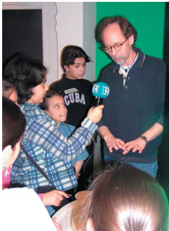
Radio im Museum