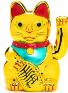
„Maneki-neko“, Foto: Bad. Landesmuseum, Peter Gaul

Badische Neueste Nachrichten, 25.02.2020