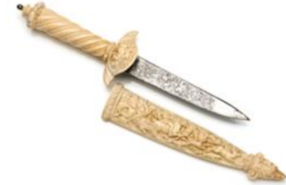
Elfenbein-Prunkdolch mit Scheide, Foto: Bad. Landesmuseum, Peter Gaul