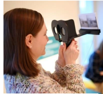
Hands-on-Station Stereoskop, Foto: artis/Uli Deck