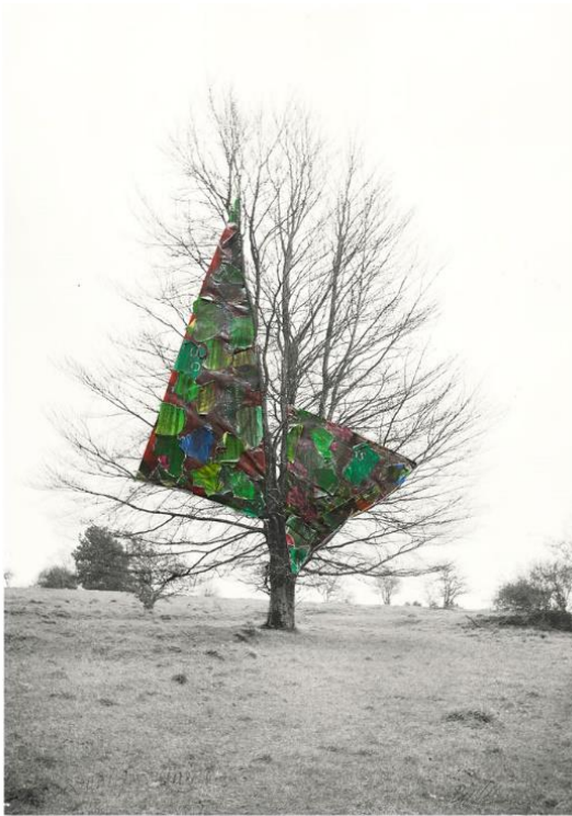
Collage aus der Serie „Baum der Träume“ von Josef Bücheler.

Das Aldinger Museum veranstaltet am Samstag, 14. Mai 2022, und am Sonntag, 15. Mai 2022, jeweils von 14.00 bis 17.00 Uhr, zusammen