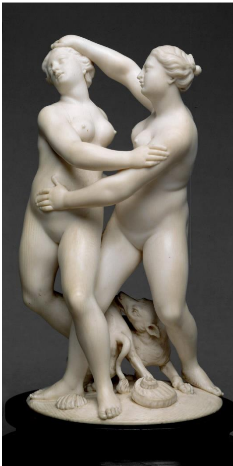
Aus der Ausstellung Barockes Ulm.

Wir freuen uns darauf, in diesem Jahr unseren Sammlungen und Sonderausstellungen, nach den Ende der Pandemiemaßnahmen, in all ihrer Vielfalt und Attraktivität wieder unmittelbar vor Ort den Besucher*innen präsentieren zu dürfen. Zusammen mit den weiteren Ulmer und Neu-Ulmer Museumsinstitutionen lässt sich ein vielseitiges und abwechslungsreiches Programm am Internationalen Museumstag mit Freude und Neugier wieder in Ulm, um Ulm, und um Ulm herum erleben.